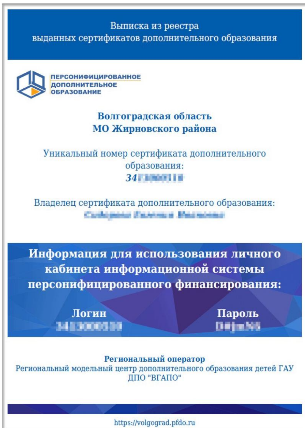
Рисунок 27 - Файл с учетными данными для входа в АИС ПФДО

Пример файла с учетными данными для входа в АИС ПФДО представлен на рисунке 27.